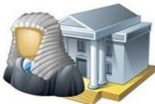
Суд общей юрисдикции, мировые судьи